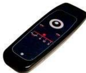
Automatski rotirajući laser RL-350GL, isporuka uklj. daljinski upravljač