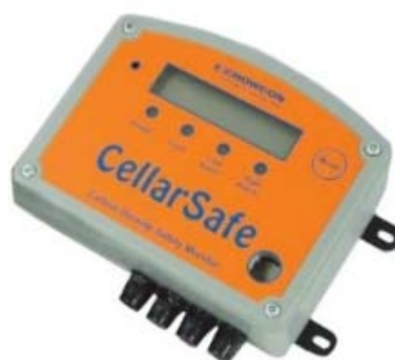
CO 2 -mjerac CellarSafe