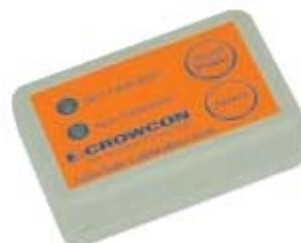
Daljinski upravljač na kabelu od 9 m