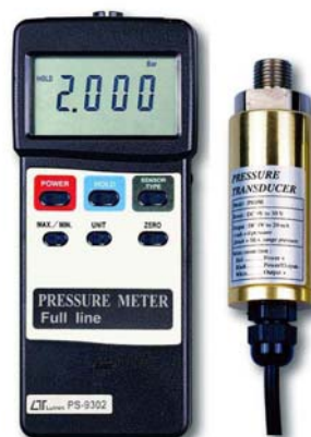
Senzor tlaka naručiti zasebno